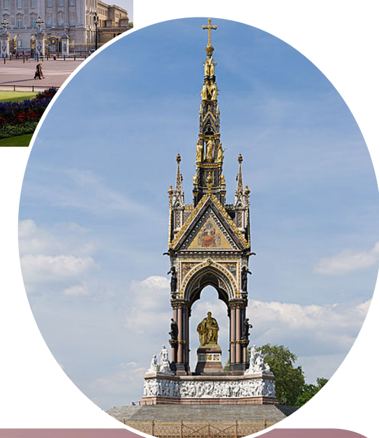
上： Buckingham Palace & Victoria Monument 中： Albert Memorial 下： Tower Bridge

第四天 游玩的是海德公園(Hyde Park)。周邊是成片的高級公寓區。據說這裏是世界上最貴的公寓樓了。路邊的梧桐樹被修剪得祇剩下少數綠葉，高樹樹枝一概剪盡，禿禿地襯着耀眼的白色公寓樓，走在街上別有一番風情。帝國學院也在這裏，路上還看見了幾個中國學生。公園很大，綠草地覆蓋着綠樹，一條石砂大道環繞着。跑步的，騎自行車的，遛狗的，抱着嬰兒散步的，和諧而自然。一汪不大的水池，白雲倒映着，幾十祇白鵝暢游于睡蓮水草之間。第一次見有這麼多的天鵝在一起，驚訝萬分。更有趣的是幾個小孩喂它們食物，全然不懼。小孩和天鵝居然玩在了一起，此情